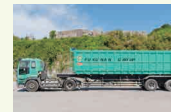
トレーラーダンプ