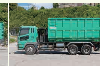
10tフォークリフト車