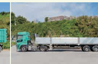
トレーラー平台車