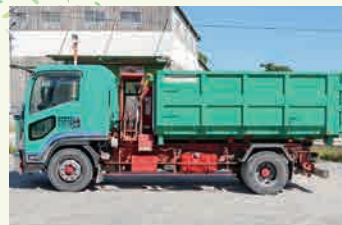
フォークリフト車